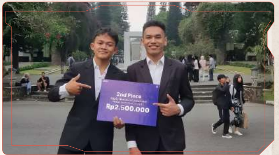
2nd Place in Equity Research Competition Category

Lomba Essay Nasional Islamic Banking Fair 2025