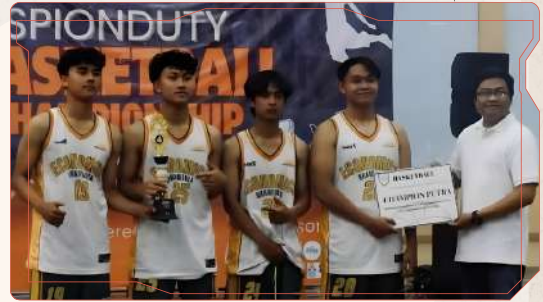
Juara 3 Nasional

National Sharia Economics Competition (NaSEC) 2025