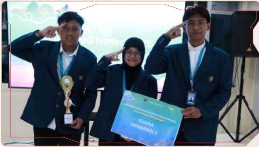
Juara Harapan 2

National Sharia Economics Competition (NaSEC) 2025