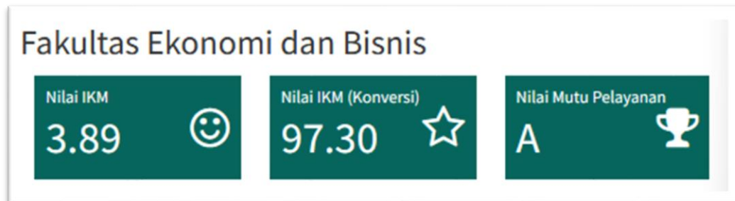
Gambar 2 Nilai IKM FEB UB Tahun 2025

Tabel dan gambar di atas menunjukkan bahwa semua unsur layanan di FEB UB mendapatkan penilaian sangat baik dari responden dengan nilai IKM setelah dikonversi sebesar 97,35 . Unsur layanan yang mendapatkan nilai paling tinggi yang diberikan oleh pengguna layanan adalah unsur Kualitas sarana dan prasarana dengan nilai 3,965 .