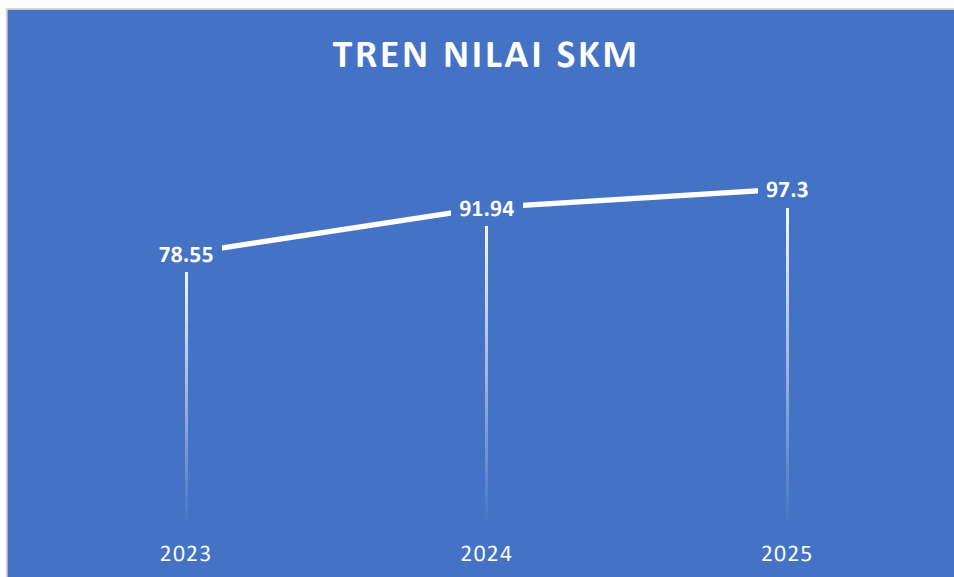
Gambar 3 Tren Nilai IKM

Perkembangan nilai IKM FEB UB dalam 3 tahun terakhir mengalami perubahan dari tahun sebelumnya. Secara berturut-turut nilai IKM FEB UB adalah 78,55 pada tahun 2023, 91,94 pada tahun 2024 dan 97,30 pada tahun 2025 sebagaimana dapat dilihat pada gambar di bawah ini.